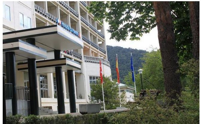
Hospital de La Fuenfría.