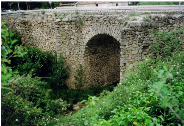
Puente de Los Molinos en Cercedilla, inicio de esta ruta.