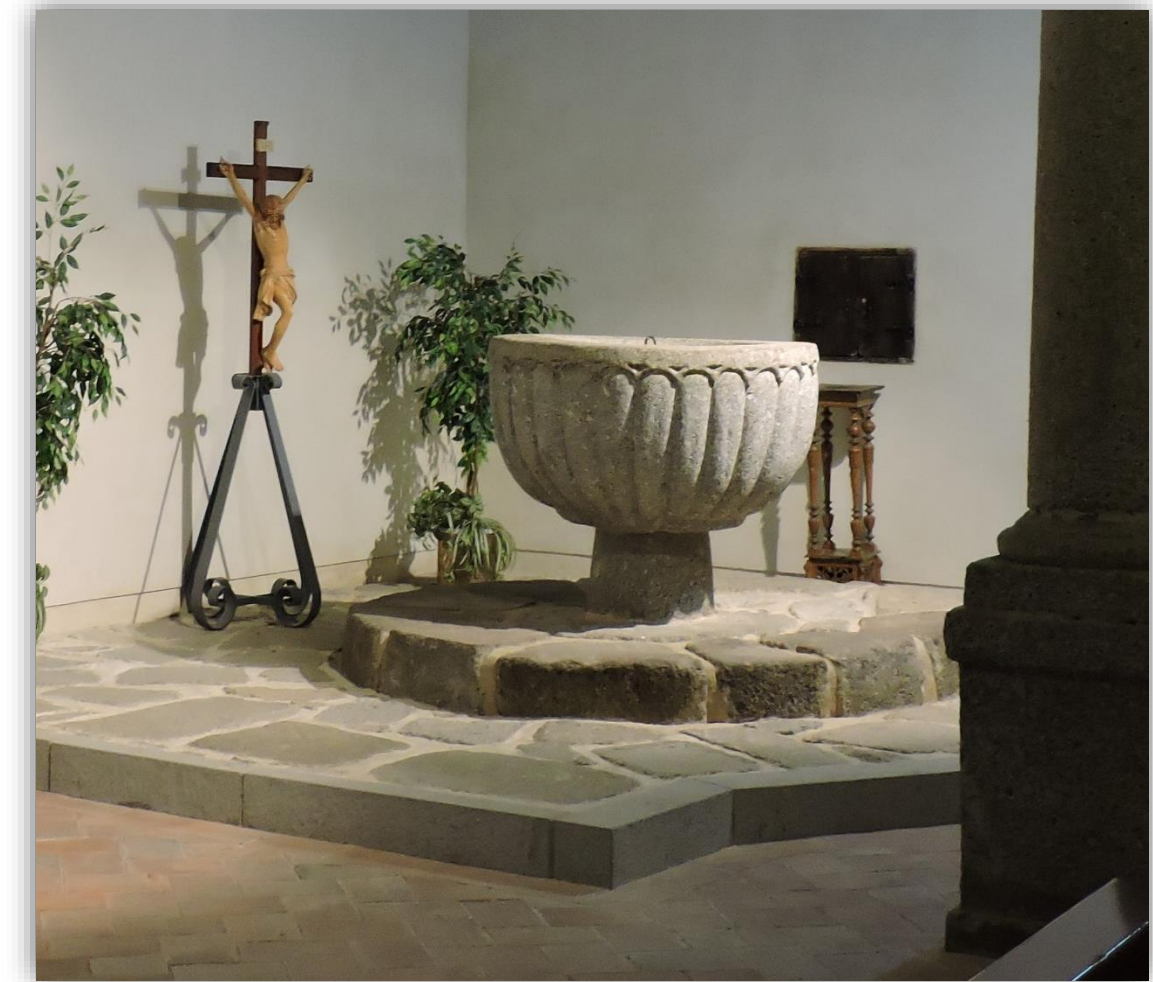
Pila bautismal gallonada

También puede visitar la Ermita de Navahonda, del siglo XVII, a los pies de la Almenara. Cuenta con un ermitaño que en caso de estar cerrada le facilitará la entrada a la misma.